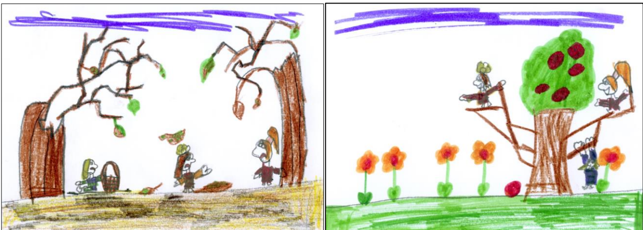
Abbildung 3: Gruselwald und Apfelbaum aus dem Buch „Die coolen Mädchen“

Die Autorin des Buchs „Der verbotene Vogel“ hat im Lauf ihrer Volksschulzeit mehr als dreißig Kleine Bücher verfasst. Während in den ersten immer wieder plötzlich hereinbrechende Bedrohungen dargestellt werden, die im Zusammenhang mit der Flucht der Familie aus Tschetschenien stehen könnten, sind die späteren frei davon. Ein Wendepunkt zeichnet sich in ihrem Buch „Die coolen Mädchen“ ab.