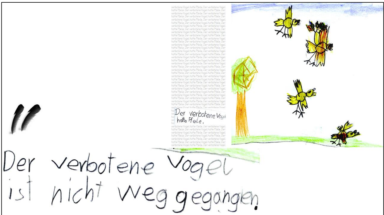
Abbildung2: Illustration zum Text „Der verbotene Vogel ist nicht weggegangen.“

Was dieses Buch für uns Leser_innen so irritierend macht, ist, dass die Vögel dem verbotenen Vogel völlig hilflos ausgeliefert sind. Weder können sie flüchten, noch ihn in die Flucht schlagen. Das plötzliche, hilflose Ausgeliefert- und Überwältigtsein, der komplette Verlust von Handlungsmacht sind wesentliche Bestandteile von Traumadefinitionen. Wenn der Körper, in höchste Alarmbereitschaft versetzt, weder mit Kampf ( fight ) noch mit Flucht ( flight ) reagieren kann, bleibt er sozusagen in der nicht zu Ende gebrachten Reaktion auf Extremstress stecken (Levine/Frederick 1998). Irritierend ist auch die ungewöhnliche syntagmatische Verknüpfung von Verbot und Vogel zu Der verbotene Vogel: ist der Täter ein geächteter? Ist die Tat verboten? Ist es verboten, darüber zu sprechen? Geschichten wie die vom verbotenen Vogel als realitätsnahe Darstellung einer konkret erlebten traumatischen Szene zu interpretieren wäre – wie in der Fachliteratur betont wird – nicht zulässig, wohl aber können sie als Hinweis auf ein selbst durchlebtes oder durch Weitergabe vermitteltes traumatisierendes Geschehen gelesen werden (Reddemann 2001).