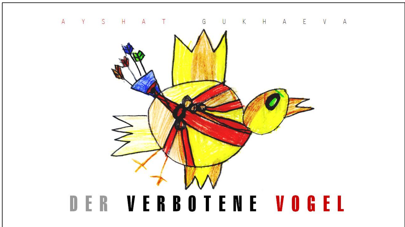
Abbildung1: Titelblatt zum Text „Der verbotene Vogel“

An den Anfang meines Beitrags stelle ich einen multimodal gestalteten Text, der im Rahmen eines Langzeitprojekts zu kreativem Schreiben und Gestalten an einer Wiener Volksschule entstanden ist. Es handelt sich um das kleine Büchlein „Der verbotene Vogel“. Das Titelbild (siehe Abb. 1/1) zeigt einen in kräftigem Gelb und Orange gezeichneten Vogel. Die roten Riemen, die – ähnlich einer Koppel – einen Köcher mit vier Pfeilen halten, verleihen ihm ein martialisches Aussehen. In seiner expressiven Darstellung zieht das Buch Aufmerksamkeit auf sich, wirkt aber, je mehr man sich darauf einlässt, verstörend.